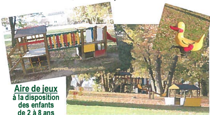
Aire de jeux à la disposition des enfants de 2 à 8 ans

Les jeux à thème permettent aux enfants de s'inventer un monde de créer des histoires, tout en exerçant leur motricité.