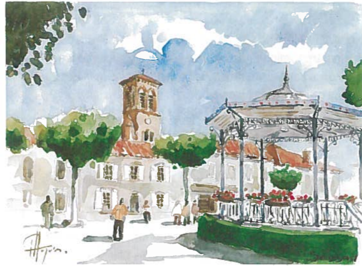
SEISSAN (vu par Patrice HYVER)

Retrouvez-nous sur le Web : seissan.free.fr